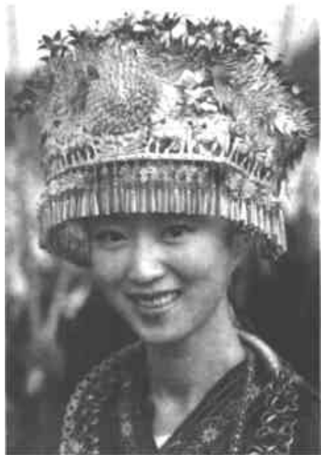
绚丽多姿的苗族服饰

化、集约化办学的方向不断前进,拓宽依托国家高等教育培养军事人才的路子,使军队院校教育由以学历教育为主转变为以继续教育为主,军队院校生长干部的学历教育基本实现大学本科化。要大力推进教育创新,优化教育结构,完善管理机制,加强校风和学风建设,提倡科学求实精神,在培养军事人才的知识基础和创新能力、提高综合素质上下功夫。