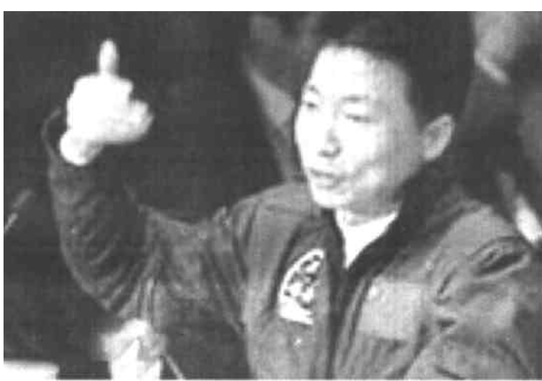
10月17日《沈阳今报》报道，祖籍辽宁绥中的杨利伟成为中国航天第一人后，绥中县县长夏雨恩透露，绥中县已申报了水果的“杨利伟”商标，并称“这也得益于某媒体报道的杨利伟最爱吃绥中大白梨的启发”。

随着“神舟”五号巡天成功，举国欢庆，航天英雄杨利伟理所当然地成为最大的新闻热点人物。然而，留心一下不难发现，这片“掌声”现在却越来越不纯粹，不谐调的嘈杂音符渐起，无论我们是否愿意看到，都必须承认：杨利伟现象实际诱发了某些人热衷“攀龙附凤”的文化劣根性。 据媒体报道，杨利伟家乡的大白梨也因了航天英雄而成名：“杨利伟”三字已被其祖籍辽宁绥中县抢注为水果商标。 不能否认，“借光”杨利伟本来是个正常的思路，“杨利伟”确实也已让绥中县近乎成为免费的（广告）“霸王”。但发展经济，这种“飞来的名气”是否可靠呢？不必细讲经济学的道理，仅从中央电视台的历年“广告标王”的命运来看，显然是不行的。名气只是“外因”，发展经济还是踏踏实实、一步一个脚印的积累更可靠，把宝过多地押在偶然的杨利伟身上，说白了，这是活脱脱的投机心态。 我想说，面对英雄这种“一哄而上”、“攀龙附凤”、“一心想着‘沾光’”的做法是过份的。假如我们真的尊敬英雄的话，就不能这么急匆匆地只将英雄沦为逐利的道具。 一哄而上，然后再一哄而下，好大喜功，一心想着投机取巧，美其名曰“抓住机会”，实际上却是做事无恒心无常性，是某些国人的痼疾，是我们文化之中的劣根性。