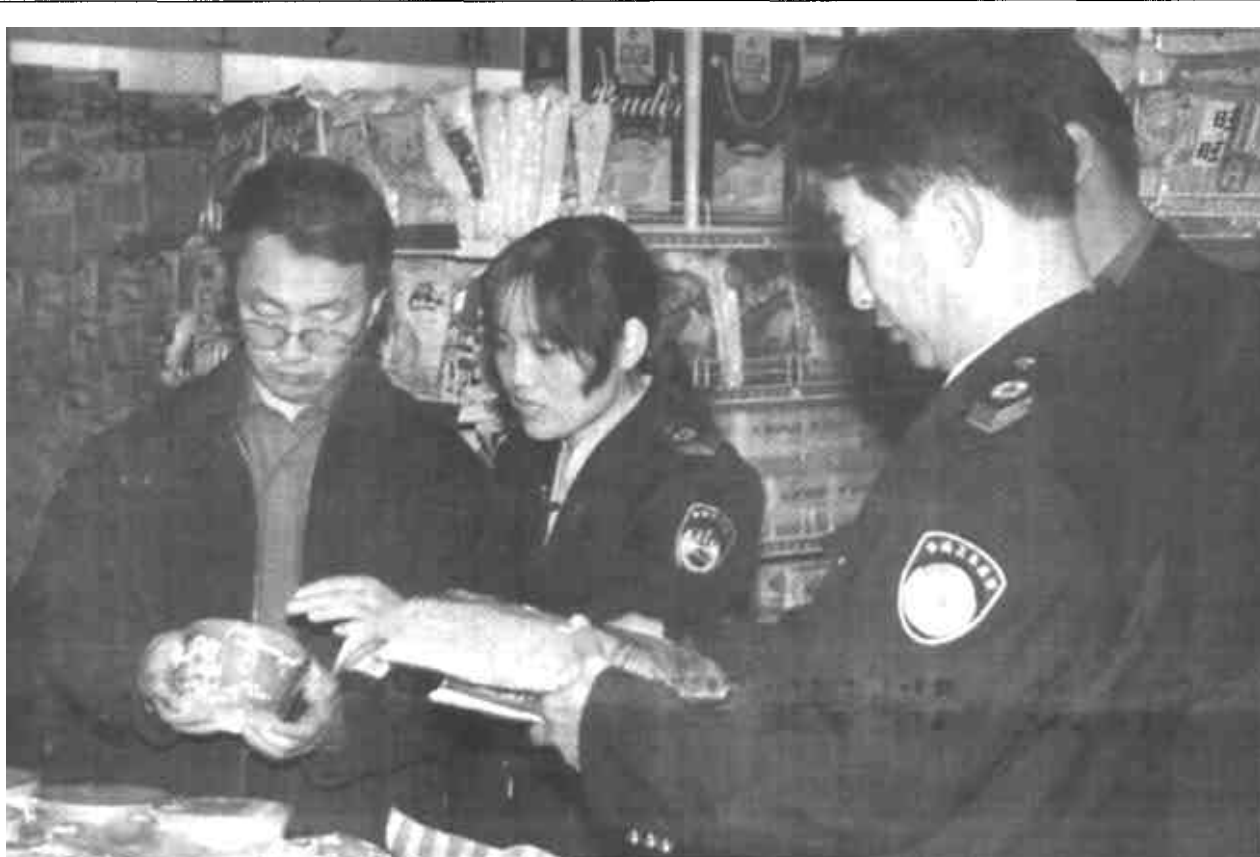
为巩固我市“双创”成果，营造食品安全环境，促进人民身体健康，近日，市卫生防疫站和市健康教育所联合市天河银座餐饮有限责任公司、垦利酒厂上街宣传《食品卫生法》和《食品安全行动计划》，先后发放宣传资料2万余份，接受群众咨询3000余人，并深入生产、销售企业监督检查。